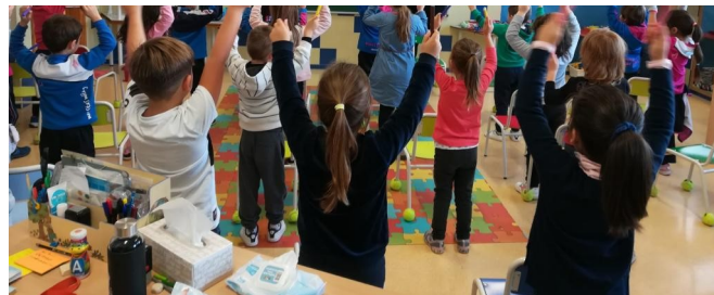
Trece alumnos alemanes de 5 años estuvieron la pasada semana en el colegio de los Maristas en la primer proyecto de este tipo en España.

España que se realiza una movilidad del programa Erasmus+ con alumnos tan pequeños y la experiencia ha resultado tan interesante que el SEPIE, el Servicio Español para la Internacionalización de la Educación, ya ha pedido información a este centro educativo de Málaga para analizar los resultados.