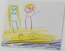
eine sandige Geschichte der Kinder aus dem FRÖBEL Kindergarten Krabbenweg

Es waren einmal zehn FreundInnen aus dem Kindergarten, die in eine Klasse eingeladen um mit ihnen Churros zu essen und im Meer zu schwimmen. Ihre ErzieherInnen erzählten ihnen, dass dort jeden Tag die Sonne scheint, die Meeresfrüchte frisch sind und das Meer grün und blau ist. Dank dem Projekt Erasmus konnten die neun Malaga reisen und das erste was Sie dort machten war den Strand zu besuchen. Beim Spielen und Sandburgenbauen konnten sie viele neue Tierarten kennenlernen - Sturmpetrels, Irokesen und Sandfregaten. Um sich abzukühlen und das Meer kennenzulernen, gingen die Freunde mit ihren Tauchermasken unterwasser. Sie begegnete einem Delfin, der sehr sehr fröhlich und lustig war. Der Delfin gab den Freunden so viele Tricks, dass viele Tiere durch den Plastik im Meer krank wurden und starben. Mari und Jacob fingen an, mit Hilfe des Delfin den Müll abzusammeln. Es war aber zu viel, die 10 Freunde sammelten sich, baten ihre Freunde aus der Agrupar Schule um Hilfe und konnten so eine lange Menschenkette bilden, um den Müll einzusammeln.